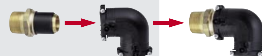
1 Přechodový díl - elektrospojka

Všechny komponenty umožňují vytvoření spolehlivého přechodu PE trubka - kov (trubkový závit) a jsou velmi důležitou součástí plynových i vodovodních řádů. Mohou být použity při napojení kulových uzavíracích kohoutů, vodoměrů, v průmyslových sítích i čerpadel, regulačních ventilů atd., přesně podle požadavku zákazníka.